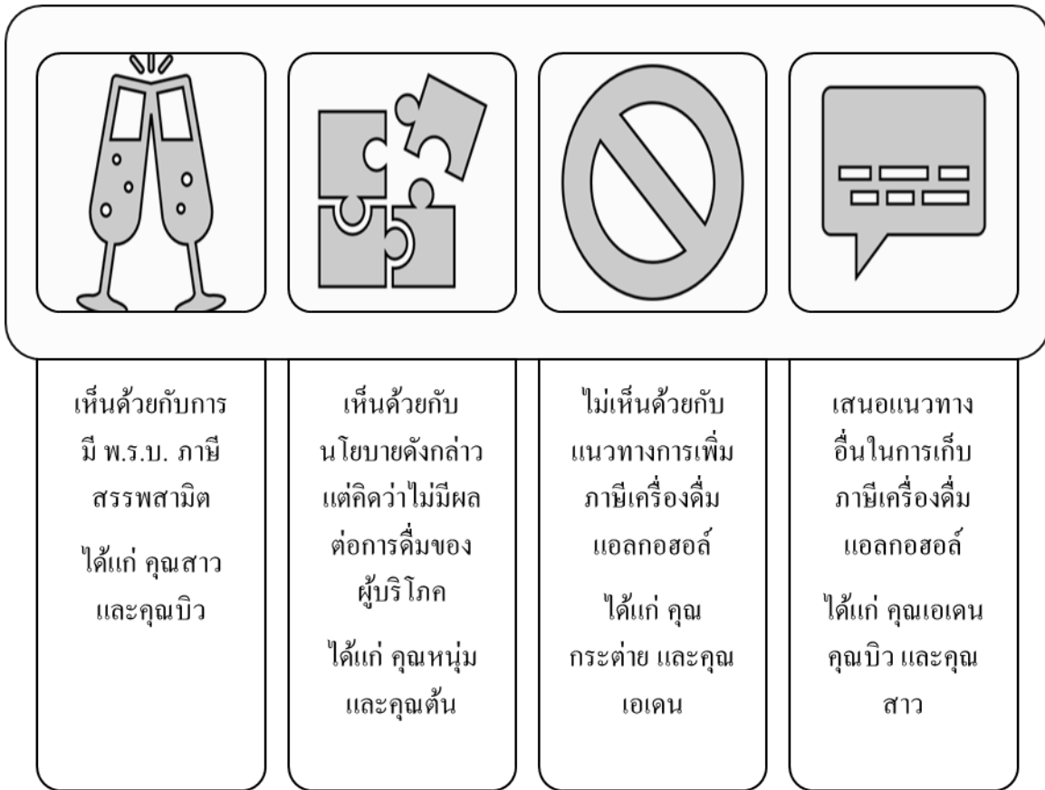
ภาพที่ 3 ภาพแสดงความคิดเห็นต่อนโยบายการเก็บภาษีเครื่องดื่มแอลกอฮอล์

กลุ่มตัวอย่างที่เห็นด้วยกับการมีพระราชบัญญัติภาษีสรรพสามิต พ.ศ. 2560 สำหรับผู้ที่เห็นด้วยกับการมีพระราชบัญญัติฯ ดังกล่าว ได้แก่ คุณสาวโดยคุณสาวมีความคิดเห็นว่า เพราะว่าการบริโภคเครื่องดื่มแอลกอฮอล์เป็นการบริโภคความเสี่ยง ทั้งความเสี่ยงที่เกิดขึ้นกับสุขภาพและความปลอดภัยของตนเอง และเสี่ยงต่อความปลอดภัยของผู้อื่น ดังนั้น การเก็บภาษีสินค้าที่ทำให้เกิดความเสี่ยงดังกล่าวมีความเหมาะสม และสามารถนำเงินรายได้จากการเก็บภาษีเหล่านั้นมาบำรุงรัฐ และใช้จ่ายสำหรับการจัดการความเสี่ยงดังกล่าวได้ด้วย