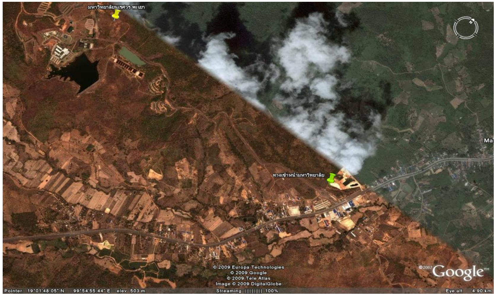
แผนที่ที่ 1 แสดงอาณาบริเวณมหาวิทยาลัยเขาสวรรค์ พะเยาและทางเข้าหน้ามหาวิทยาลัยเขาสวรรค์ พะเยา