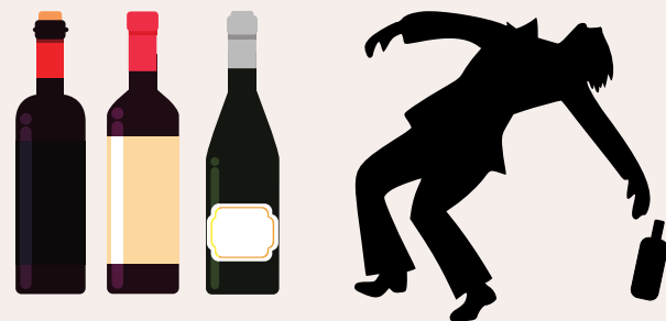
ตัวแบบเครื่องมือการทำงานร่วมกันระหว่างท้องถิ่นกับหน่วยงานส่วนกลางของรัฐในด้านการควบคุมเครื่องดื่มแอลกอฮอล์