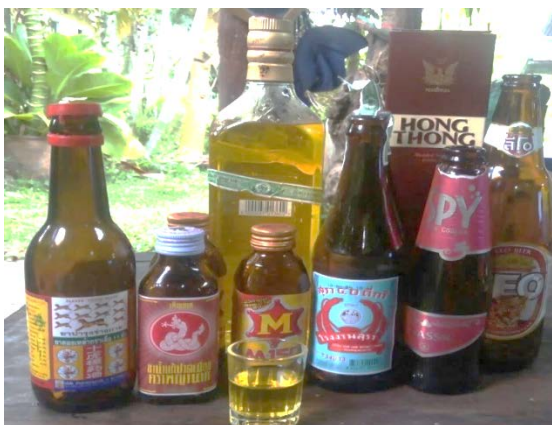
ภาพที่ 4.15 เครื่องตีแอลกอฮอล์ประเภทต่างๆ