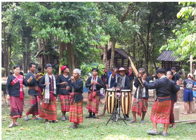
ภาพที่ 4.9 กลุ่มชาติพันธุ์ลาว