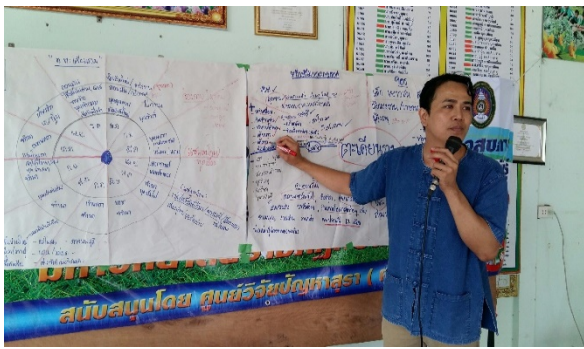
ตำบลตะเคียนราม