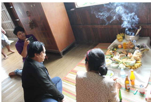
ภาพที่ 4.20 นักวิจัยร่วมสังเกตการณ์พิธีแซนโฆนตา