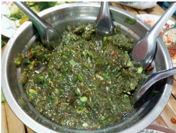
ภาพที่ 4.12 ลาบหมาน้อย