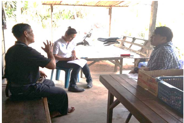
ตัวแทนกลุ่มชาติพันธุ์