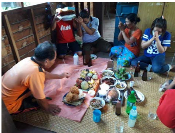
ภาพที่ 4.24 พิธีกรรมวันสารทเดือนสิบของกลุ่มชาติพันธุ์กวย (ส่วย)

อาหารไปเช่นดวงวิญญาณของผีบรรพบุรุษ ที่เจดีย์หรือธาตุที่เก็บกระดูก เป็นการอุทิศส่วนกุศลให้กับบรรพบุรุษที่ล่วงลับไปแล้วซึ่งคล้ายกับพิธีแซนโฎนตาของกลุ่มชาติพันธุ์เขมรนั่นเอง