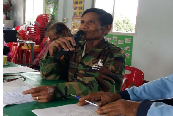
กลุ่มผู้สูงอายุ