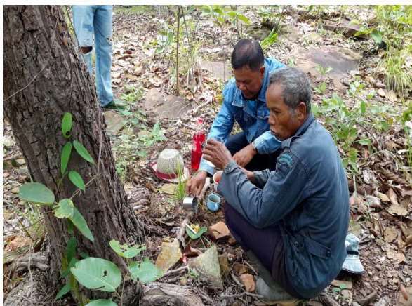
ภาพที่ 4.22 พิธีกรรมขอขมาสิ่งศักดิ์สิทธิ์ในป่าชุมชน

รูป 9 ดอก พร้อมกับตั้งจิตอธิษฐานขอให้เจ้าที่เจ้าทาง เจ้าป่า เจ้าเขา ผีเห่า ผีเรือน เจ้าของที่ เจ้าของทาง เพื่อขอเปิดป่า หรือเปิดทางหรือให้บรรลุมผลสำเร็จในการทำกิจกรรมในเขตพื้นที่ป่าเขา ดังภาพที่ 4.22