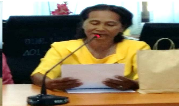
กลุ่มสตรี แม่บ้าน