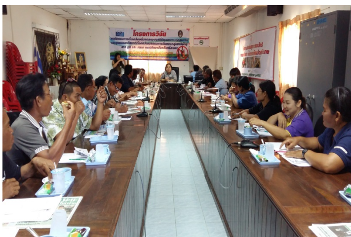
ภาพที่ 4.6 เวทีประชุมชี้แจงโครงการวิจัยพื้นที่ตำบลห้วยตามอญ

ตำบลห้วยตามอญ อำเภอกงสุรินทร์ จังหวัดศรีสะเกษ มีพื้นที่อาณาเขตทั้งหมด 103.60 ตารางกิโลเมตร หรือประมาณ 64,750 ไร่ ลักษณะภูมิประเทศเป็นพื้นที่ป่าภูเขา ป่าเชิงเขาสลับที่ราบลุ่ม มีลำห้วยธรรมชาติสำคัญ ได้แก่ ลำห้วยสำราญ ลำห้วยจังกะและลำห้วยลันดาข ไหลผ่านสภาพพื้นดินเป็นดินร่วนปนทราย พืชเศรษฐกิจที่สำคัญคือ ข้าว มันสำปะหลัง ยางพาราและปาล์ม น้ำมันบางส่วน เป็นต้น ตำบลห้วยตามอญเป็นตำบลพื้นที่ที่มีประชากรหลากหลายชาติพันธุ์ โดยส่วนใหญ่เป็นกลุ่มชาติพันธุ์เขมร รองลงมาคือ ชาติพันธุ์ลาว และชาติพันธุ์ส่วยตามลำดับ บริบทด้านสังคม ประชาชนชาวตำบลห้วยตามอญมักอาศัยอยู่ร่วมกันเป็นชุมชนขนาดใหญ่ ในหมู่บ้านต่าง ๆ มีความผูกพันเกี่ยวข้องกับเครือญาติ มีระบบการนับถือกันตามความอาวุโสแบบสังคมชนบทไทยทั่วไป มีขนบธรรมเนียมประเพณีเหมือนกับพื้นที่อื่นๆ ในอำเภอกงสุรินทร์ ประเพณีที่สำคัญได้แก่ เช่น ประเพณีวันสงกรานต์ ประเพณีลอยกระทง ประเพณีบุญบั้งไฟ ประเพณีเข้าพรรษา-ออกพรรษา ประเพณี วันปีใหม่ เป็นต้น และที่สำคัญที่สุดที่แตกต่างไปจากท้องถิ่นอื่นๆ คือ ประเพณีวันแซนโฎนตา (แรม 15 ค่ำ เดือน 10) เป็นประเพณีสืบทอดกันมาแต่โบราณกาลจนถึงปัจจุบันของกลุ่มชาติพันธุ์เขมร ประกอบอาชีพของประชาชนชาวตำบลห้วยตามอญ ส่วนใหญ่ประกอบอาชีพเกษตรกรรม ได้แก่ การทำนาปลูกข้าว ทำไร่มันสำปะหลัง และทำสวนยางพารา และปลูกพืชผักไว้รับประทานในครัวเรือน อาชีพรองได้แก่ อาชีพรับจ้างทั่วไปและรายได้เสริมหลังฤดูเก็บเกี่ยว ได้แก่ การทอผ้า ค้าขายบางส่วน เลี้ยงสัตว์ เป็นต้น ด้านเศรษฐกิจพื้นที่ตำบลห้วยตามอญค่อนข้างดี เนื่องจากพื้นที่ส่วนใหญ่เหมาะสมแก่การทำนา เพาะปลูกพืชไร่ พืชสวน และไม้ยืนต้น ทำให้ราษฎรในพื้นที่มีรายได้เพียงพอแก่การยังชีพ