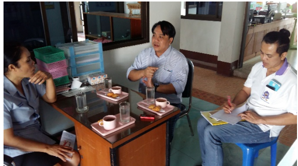
ตัวแทนกลุ่มชาติพันธุ์