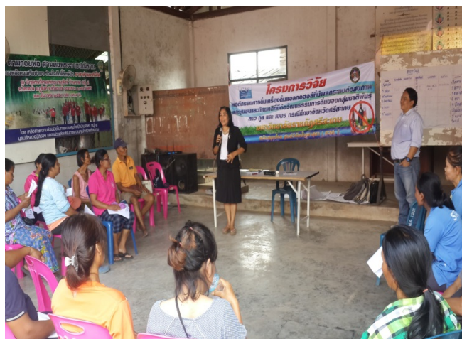
ภาพที่ 4.2 เวทีประชุมชี้แจงโครงการวิจัยพื้นที่ตำบลโคกตาล

ตามความเคยชินและสภาพพื้นที่เท่าที่จะเอื้ออำนวย นอกจากนี้ยังมีการทำไร่มันสำปะหลัง และทำสวนยางพารา และทำนาข้าวในพื้นที่ราบลุ่ม สภาพบริบทและภูมิศาสตร์จึงคล้ายกับตำบลดงรักเพราะเป็นพื้นที่ติดต่อกัน สภาพสังคมและสภาพแวดล้อมโดยทั่วไปแล้ว พบว่าตำบลโคกตาล เป็นตำบลในเขตชนบท มีสภาพแวดล้อมที่เป็นธรรมชาติ มีภูเขาน้อยใหญ่ตามแนวเทือกเขาพนมดงรัก ลำห้วยธรรมชาติสำคัญ ได้แก่ ห้วยศาลา สภาพพื้นที่ราบลุ่มเป็นทุ่งนา การประกอบอาชีพเกษตรกรรมส่วนใหญ่มีความคล้ายคลึงกัน นอกจากนี้ระบบการทำการเกษตรส่วนใหญ่ยังเป็นแบบยังชีพ (Subsistence) ครอบครัวเดียวกันจะประกอบอาชีพอย่างเดียวกันหรืออาจจะมียาชีพเสริมบ้างบางครั้งเรือน รายได้ส่วนใหญ่มาจากภาคเกษตรกรรม ดังนั้นประชาชนในพื้นที่จึงมีรายได้น้อยและไม่แน่นอน ความหนาแน่นของประชากร พบว่าพื้นที่ตำบลโคกตาลมีจำนวนประชากรอาศัยอยู่ไม่หนาแน่น ถนนหนทางสามารถสัญจรไปมาสะดวก บริบทด้านสังคม ในพื้นที่ตำบลโคกตาลมีลักษณะของสังคมแบบชนบทไทยในอดีต คือประชาชนทุกคนรู้จักกันหมดทั้งหมู่บ้าน กิจกรรมและพิธีกรรมพื้นบ้านยังคงยึดถือปฏิบัติตามกลุ่มชาติพันธุ์ดั้งเดิมของตนเอง และยังคงรักษายึดถือปฏิบัติกันเรื่อยมาอย่างต่อเนื่อง จุดเด่นสำคัญของชุมชนตำบลโคกตาล คือสมาชิกของครอบครัวแต่ละกลุ่มชาติพันธุ์มีความสัมพันธ์กันอย่างแน่นแฟ้น สมาชิกในชุมชนจะให้ความสำคัญในเรื่องความเป็นมิตรต่อเพื่อนบ้าน มีการติดต่อช่วยเหลือกันแบบเป็นกันเอง มีความเอื้อเฟื้อและจริงใจต่อกัน