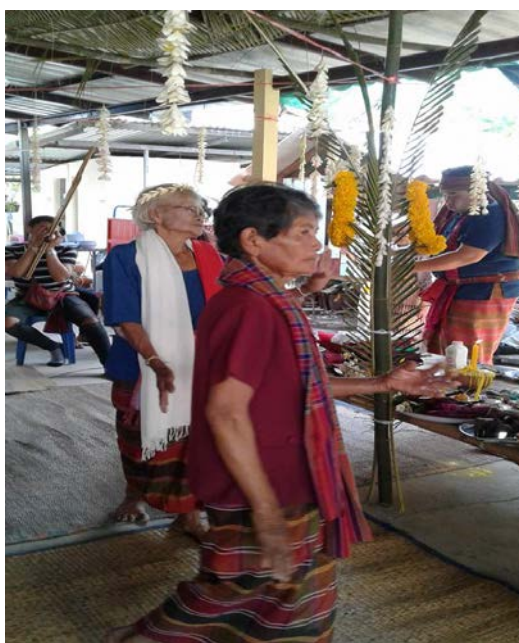
ภาพที่ 4.21 พิธีรำผีฟ้า

เจ็บป่วยของคนป่วย และมีสุราหรือเครื่องดื่มแอลกอฮอล์ ประกอบเป็นเครื่องไหว้บูชา เพียงแต่ผู้นำพิธี ผู้นำจะไม่ดื่มสุราหรือเครื่องดื่มแอลกอฮอล์ เท่านั้นเอง สุราและเครื่องดื่มแอลกอฮอล์เป็นส่วนหนึ่งของการดำรงชีวิตของกลุ่มชาติพันธุ์ลาว และเป็นองค์ประกอบสำคัญในพิธีกรรมและบุญประเพณีสำคัญของกลุ่มชาติพันธุ์ลาว อาทิ พิธีรำผีฟ้า เป็นการฟ้อนรำประกอบดนตรี โดยมีจุดมุ่งหมายคือเป็นการรักษาคนป่วยแบบโบราณ รำผีฟ้าเป็นการรำที่แสดงออกซึ่งความเชื่ออย่างหนึ่งของกลุ่มชาติพันธุ์ลาว ไม่ใช่การละเล่นหรือการแสดงเพื่อความสนุกสนานบันเทิงใจ แต่เป็นการรำเพื่อบูชาเทพเจ้าหรือสิ่งศักดิ์สิทธิ์ที่กลุ่มชาติพันธุ์ลาวเคารพนับถือ ผู้ทำพิธีนี้ เรียกว่า หมอลำผีฟ้า หมอลำผีฟ้าจะทำหน้าที่เป็นตัวกลางในการติดต่อกับพระยาแถนซึ่งเป็นเสมือนเทพเจ้า และญาติผู้ป่วยหรือผู้ป่วย ผู้ที่เป็นหมอลำผีฟ้าส่วนใหญ่จะเป็นเพศหญิง ดังภาพที่ 21