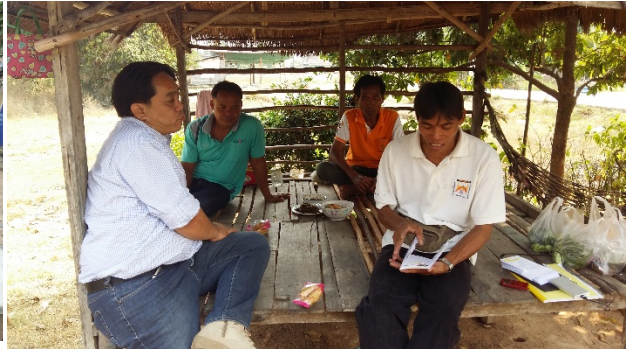
ตัวแทนกลุ่มชาติพันธุ์