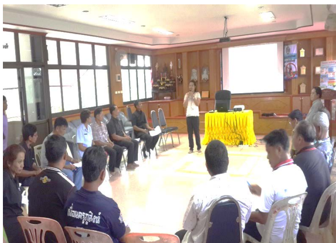
ภาพที่ 4.5 เวทีประชุมชี้แจงโครงการวิจัยพื้นที่ตำบลละลม

เกี่ยวข้องกับแบบเครือญาติ นับถือความอาวุโสแบบสังคมไทยทั่วไป มีขนบธรรมเนียมประเพณี เหมือนกับชุมชนชนบทอีสานโดยทั่วไป เช่น บุญประเพณีปีใหม่ ในเดือนมกราคม ประเพณีรำแม่ผัด ซึ่งเป็นพิธีกรรมอย่างหนึ่งของกลุ่มชาติพันธุ์เขมร เรียกอีกอย่างว่า “เรื่อมมะมั่วด” หรือรำแม่ผัด ในเดือนเมษายนจะมีบุญสงกรานต์ งานบวช งานแต่ง ในเดือนพฤษภาคม และมีอุยาน บุญเข้าพรรษาในเดือนกรกฎาคม บุญข้าวสาก แชนโถงตา (การไหว้วิญญาณบรรพบุรุษ) ในเดือนกันยายน และ ตุลาคม บุญฐินในเดือนพฤศจิกายน เป็นต้น ส่วนบุญผ้าป่า งานแต่งงาน งานบวช การไหว้ศาลปู่ตาหรือศาลตาปู่ บุญเลี้ยงบ้านหรือผีปู่ตา ยังคงปฏิบัติแต่จะแตกต่างกันไปตามแต่ละหมู่บ้านแต่ละกลุ่มชาติพันธุ์ที่นับถือปฏิบัติต่างกัน