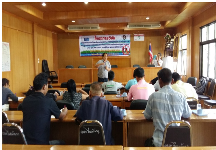
ภาพที่ 4.4 เวทีประชุมชี้แจงโครงการวิจัยพื้นที่ตำบลไพรพัฒนา

ไม่ปลอดภัยมีสารพิษปนเปื้อน หรือแม้แต่พฤติกรรมกรรมการบริโภคที่เหมาะสม เช่น การดื่มสุราตอนตื่นนอน หรือดื่มก่อนเข้าไปกรีดยางในสวนยางพารา ดื่มพร้อมกาแฟตอนเช้าเพราะเชื่อว่าทำให้มีพลังกำลัง เป็นต้น