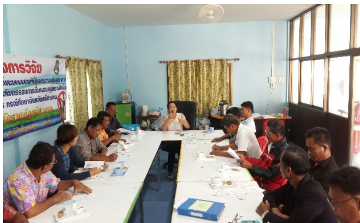
ภาพที่ 4.7 เวทีประชุมชี้แจงโครงการวิจัยพื้นที่ตำบลห้วยตึกชู