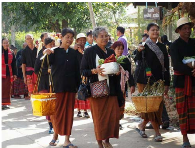
ภาพที่ 4.14 กลุ่มชาติพันธุ์กูย(ส่วย)พื้นที่ชายแดนจังหวัดศรีสะเกษ

จากภาพ 4.14 ทำให้ทราบว่าประชาชนกลุ่มชาติพันธุ์กูย (ส่วย) ในพื้นที่ชายแดน ยังคงมีความสัมพันธ์กับวิถีชีวิตและวัฒนธรรม ความเชื่อ ประเพณีต่างๆ ที่มีมายาวนาน การจัดหาสุรา และเครื่องดื่มแอลกอฮอล์ จะมีไว้ทั้งในงานมงคล งานพิธีกรรมต่างๆ และโอกาสสำคัญๆ ซึ่งสุราและเครื่องดื่มแอลกอฮอล์ กลุ่มชาติพันธุ์กูย (ส่วย) ถือว่าเป็นสัญลักษณ์ของการแสดงหรือบอกรถึงฐานะทางด้านเศรษฐกิจของบุคคลนั้นๆ พฤติกรรมการดื่มสุราและเครื่องดื่มแอลกอฮอล์โดยทั่วไป มักจะปรากฏชัดในพื้นที่ชุมชนทั่วไป เนื่องจากมีร้านค้าจำหน่ายสินค้าและสุราทั่วไปเหมือนดังเช่นพื้นที่อื่น สินค้าประเภทสุราและเครื่องดื่มแอลกอฮอล์ที่ร้านค้าจำหน่าย อาทิเช่น สุราขาว เบียร์ยี่ห้อต่างๆ สบาย พญานาค สาโท ซึ่งในช่วงเทศกาลงานบุญประเพณีสำคัญๆ จะขายดี