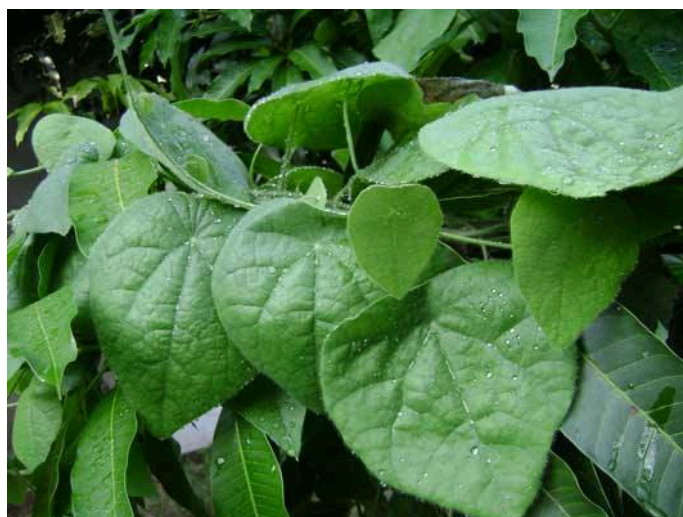
ภาพที่ 4.13 เครื่องหมาน้อย

ภาษากูย (ส่วย) เรียกสุราว่า “บล้อง” แบบพฤติกรรมการดื่มสุราและเครื่องดื่มแอลกอฮอล์ของกลุ่มชาติพันธุ์กูย(ส่วย)ในพื้นที่ชายแดนจังหวัดศรีสะเกษ