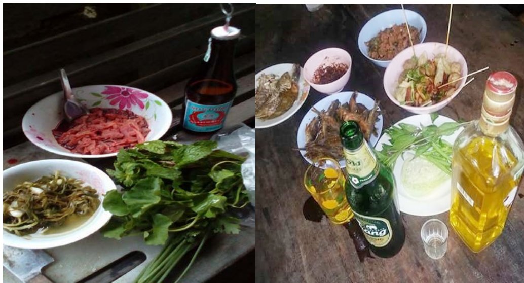
ภาพที่ 4.10 สุราและเครื่องดื่มแอลกอฮอล์กับอาหารกลุ่มชาติพันธุ์ลาว

ร้านค้าที่มีโต๊ะให้นั่ง สุราและเครื่องดื่มแอลกอฮอล์ขายดีที่สุดในกลุ่มชุมชนชาติพันธุ์ลาว คือเปียร์ลิโอ โดยจะขายในราคาขวดละ 60 บาท และสุราขาว 40 ดีกรี ขนาดเล็ก ราคา 55 - 60 บาท ส่วนสุราสี เช่น หงส์ทอง จะขายดีช่วงเทศกาล การดื่มสุราหรือเครื่องดื่มแอลกอฮอล์ของกลุ่มชาติพันธุ์ลาวควบคู่กับการรับประทานอาหารในแต่ละมื้อเช่น ในช่วงมื้อเช้า และมื้อเย็น ผู้ดื่มเชื่อว่าการดื่มสุราจะช่วยบำรุงร่างกาย ทำให้เจริญอาหาร กลุ่มชาติพันธุ์ลาวส่วนใหญ่นิยมบริโภคสุราและเครื่องดื่มแอลกอฮอล์ตลอดปีไม่ว่าจะเป็นช่วงเทศกาลหรือไม่ก็ตาม ดังภาพที่ 4.10-4.11