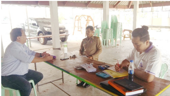
ตัวแทนกลุ่มชาติพันธุ์