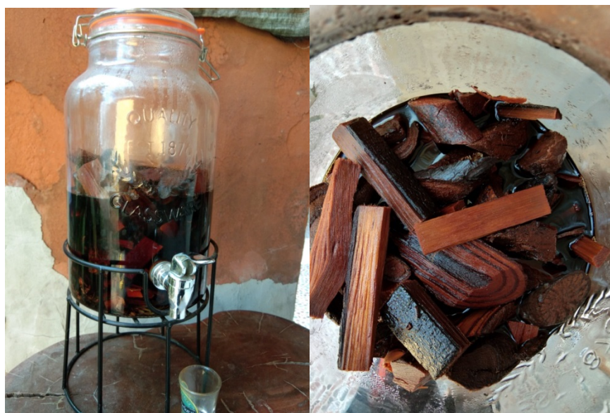
ภาพที่ 4.17 ยาสมุนไพรดองสุราขาว

จากภาพ 4.17 ยาสมุนไพรดองสุราขาว เป็นเครื่องดื่มบำรุงกำลังและเป็นที่ยอมรับของกลุ่มชาติพันธุ์ลาว ในเขตพื้นที่ชายแดน จังหวัดศรีสะเกษ เป็นอย่างมาก โดยสมุนไพรที่นำมาทำสุราขาว โดยหาได้จากป่าชุมชนในพื้นที่ อาทิ กำลังเสือโคร่ง วานปลาไหลเผือก รวงแดง โดไม่รู้ล้ม เปล้ากำลังวัวเถลิง สรรพคุณของยาต้องเหล้าส่วนใหญ่ จะช่วยบำรุงธาตุ บำรุงกำลัง บำรุงโลหิต แก้ปวดเมื่อยกล้ามเนื้อ ปวดหลัง ปวดเอว แก้กษัยเส้นเอ็นตึง ยาอายุวัฒนะ บำรุงธาตุ และดื่มขับเลือดในสตรีหลังคลอด หรือขับเลือดพิษในร่างกาย