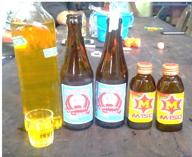
ภาพที่ 4.16 สุราขาวผสมเครื่องดื่มบำรุงกำลัง