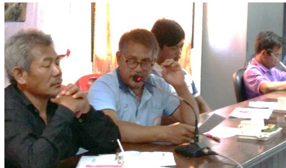
กลุ่มผู้จัดงานฯ