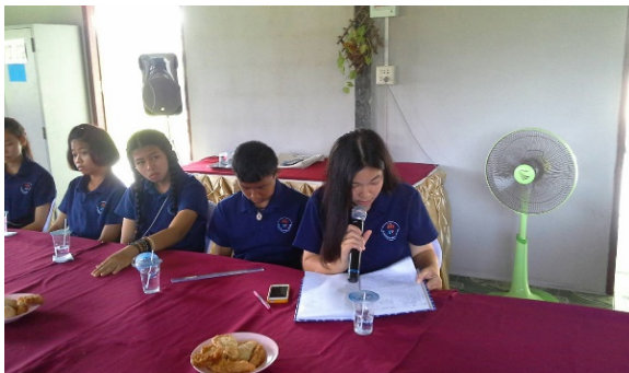
กลุ่มเยาวชน