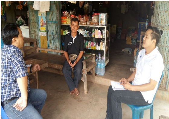
ตัวแทนกลุ่มชาติพันธุ์