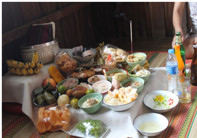
ภาพที่ 4.19 เครื่องไหว้ในพิธีแซนโฆนตา