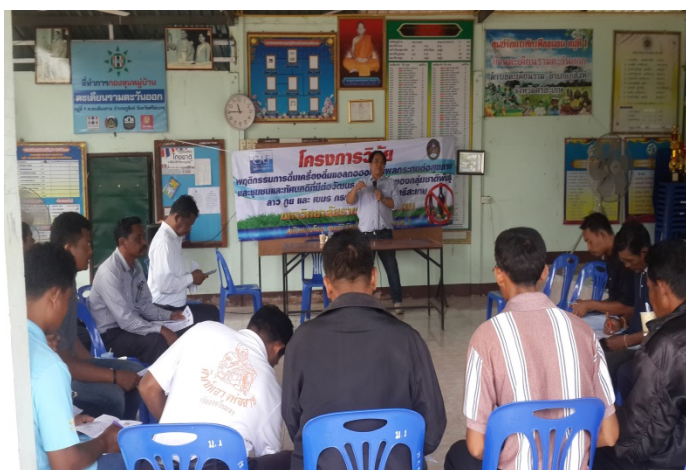
ภาพที่ 4.3 เวทีประชุมชี้แจงโครงการวิจัยพื้นที่ตำบลตะเคียนราม

ดังนั้นจะเห็นว่า การประกอบอาชีพหลักของประชาชนภายในตำบล ยังขึ้นอยู่กับประกอบอาชีพเกษตรกรรม คือ การทำนาข้าว อาชีพรองได้แก่ การทำไร่ ไร่จำจาง เป็นต้น สภาพบริบททางสังคมของตำบลตะเคียนราม จากเวทีประชุมชี้แจงโครงการวิจัยพื้นที่ตำบลตะเคียนราม ดังภาพ 4.3 พบว่า ตำบลตะเคียนรามเป็นชุมชนที่มีมาแต่สมัยกรุงศรีอยุธยาตอนปลาย หรือประมาณ 200 กว่าปี ประชาชนที่อาศัยอยู่ยังไม่หนาแน่นมากนักกระจายตามพื้นที่ทั่วไป สภาพถนนหนทางสามารถสัญจรไปมาสะดวก ตำบลตะเคียนรามมีลักษณะของสังคมแบบชนบท เป็นชุมชนที่มีความเข้มแข็งเนื่องจากเป็นหมู่บ้านเศรษฐกิจพอเพียง มีกลุ่มอาชีพมากมายเช่น ทอผ้าไหม เพาะเห็ด เลี้ยงปลา ทำปุ๋ยชีวภาพ เป็นต้น ประชาชนทุกคนในชุมชนมีความสนิทสนมรู้จักกันหมดทั้งหมู่บ้าน ประเพณีและพิธีกรรมพื้นบ้านยังคงยึดถือปฏิบัติตามกันมาแต่บรรพบุรุษ และยังคงรักษายึดถือปฏิบัติกันเรื่อยมาอย่างต่อเนื่อง จุดเด่นสำคัญของชุมชนตำบลตะเคียนราม คือ ครัวเรือนในชุมชนส่วนใหญ่มาจากต้นตระกูลเดียวกันซึ่งเป็นตระกูลใหญ่ เช่น ตระกูลตะเคียนราม ตะเคียนเกลี้ยง บุตะเคียน เป็นต้น