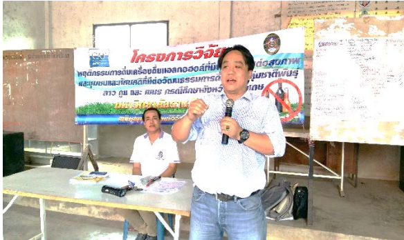
ตำบลโคกตาล