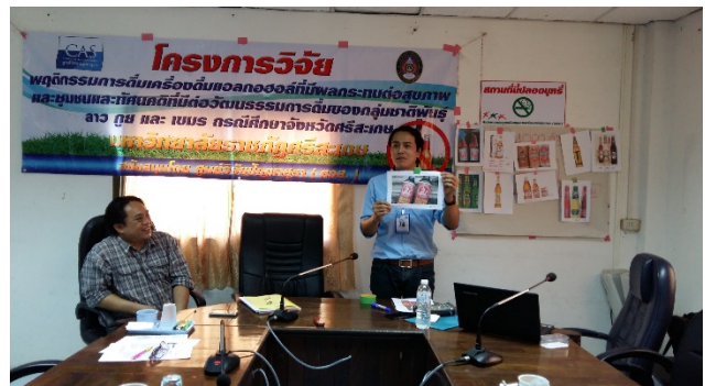
ตำบลห้วยตามอญ