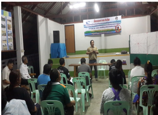
ภาพที่ 4.1 เวทีประชุมชี้แจงโครงการวิจัยพื้นที่ตำบลดงรัก

โรค ที่อยู่อาศัย และมีพื้นที่บางส่วนเป็นภูเขา ประชาชนส่วนใหญ่ จึงประกอบอาชีพเกษตรกรรม โดยเฉพาะการทำไร่หมุนสำหรับปลูก ทำสวนยางพารา และทำนาข้าวในพื้นที่ราบลุ่ม ดังภาพที่ 4.1