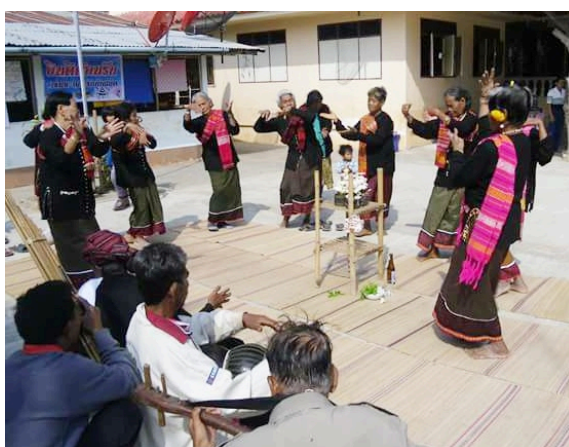
ภาพที่ 4.23 พิธีกรรมรำแม่สะเองหรือสะเอ็ง

(เหลี่ยม ธรรมพร, 2560, มีนาคม 7 : บทสัมภาษณ์ )