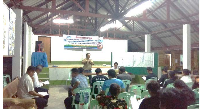
ตำบลดงรัก