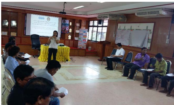
ตำบลละลม