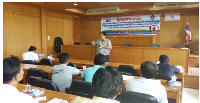
ตำบลไพรพัฒนา