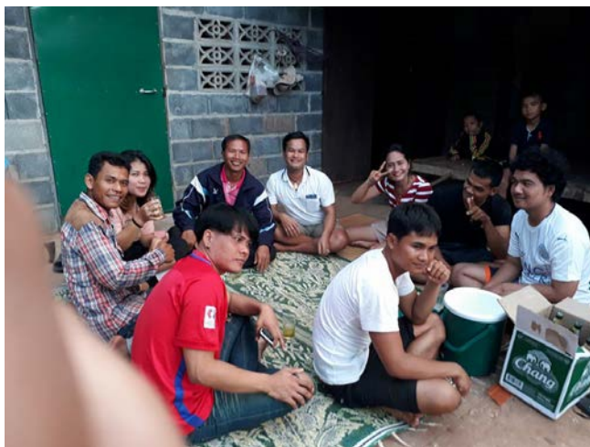
ภาพที่ 4.8 กลุ่มเยาวชนกลุ่มชาติพันธุ์เขมรในพื้นที่ชายแดนจังหวัดศรีสะเกษ

หงส์ทอง แสมโสม เบลนด์ 285 และสุราขาว หรือเหล้าขาว ส่วนในกลุ่มเยาวชนนั้นพบว่า เยาวชนมีพฤติกรรมการดื่มสุราและเครื่องดื่มแอลกอฮอล์ โดยส่วนใหญ่นิยมดื่มในช่วงเย็นหลังเลิกงาน หรือเลิกเรียน และในเวลาว่างวันเสาร์และอาทิตย์ ส่วนใหญ่นิยมดื่มเบียร์ โดยเฉพาะ เบียร์ลิโอบี และเบียร์ช้าง และ สุราสียี่ห้อต่างๆ เช่น หงส์ทอง เบลนด์ 285 และสุราขาว หรือเหล้าขาว ดังภาพที่ 4.8