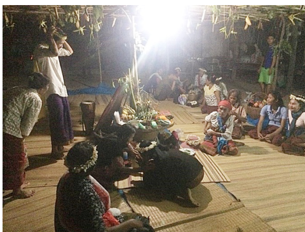
ภาพที่ 4.18 พิธีกรรมรำแม่มด

(กำพล ธรรมพร. 2560, ตุลาคม 11 : บทสัมภาษณ์ )