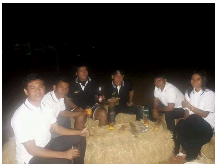
ภาพที่ 4.11 กลุ่มเยาวชนชาติพันธุ์ลาวจับกลุ่มดื่มเครื่องดื่มแอลกอฮอล์