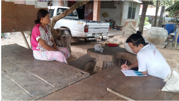
ตัวแทนกลุ่มชาติพันธุ์

ภาพลงพื้นที่เก็บข้อมูลเชิงลึกกลุ่มเป้าหมายในพื้นที่ที่เกี่ยวข้อง (การวิจัยเชิงคุณภาพ)